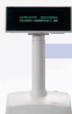
SCD122U カスタマディスプレイ