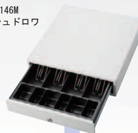
SMD146M キャッシュドロワ