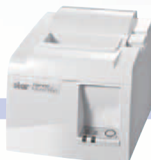
スター精密 小型プリンタシリーズ